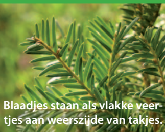
Blaadjes staan als vlakke veertjes aan weerszijde van takjes.