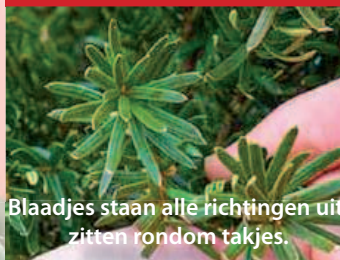
Blaadjes staan alle richtingen uit, zitten rondom takjes.

Taxus baccata (links) en Taxus 'Hicksii' (rechts).